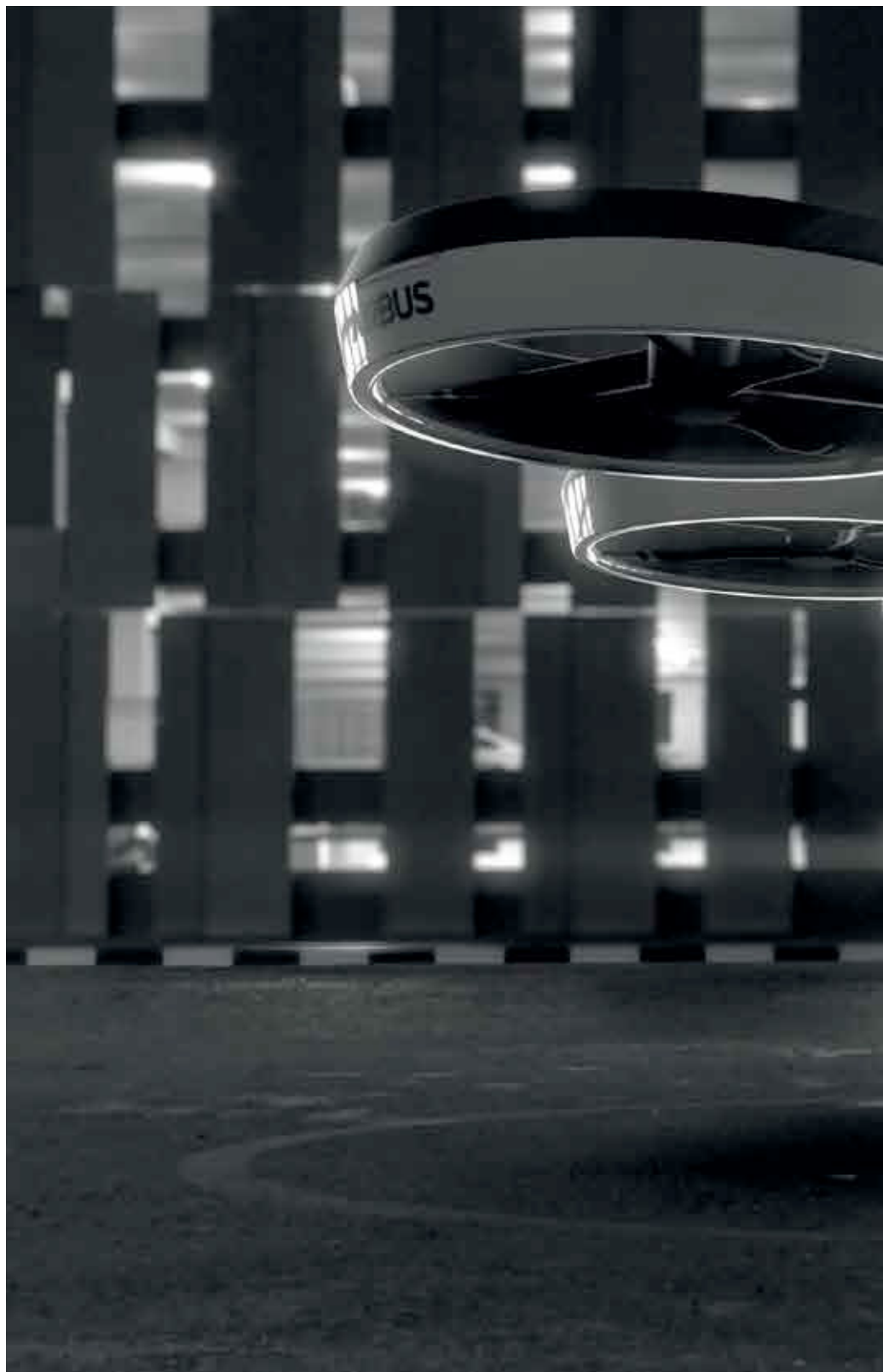
foto Avrio Drone, Matthias Ziegler, Airbus ilustracije Raymond Biesinger

Neke priče o budućnosti zapravo se temelje na idejama iz prošlosti. Ovo je jedna od njih: potkraj 19. stoljeća američki filozof i povjesničar Henry Adams objavio je svoju autobiografiju koja je sadržavala napredna promišljanja o svijetu toga vremena. Adams je naglasio da je već prije šeste godine svjedočio kako su stvari koje su se prije smatrale nemogućima postale realnost: prekooceanski