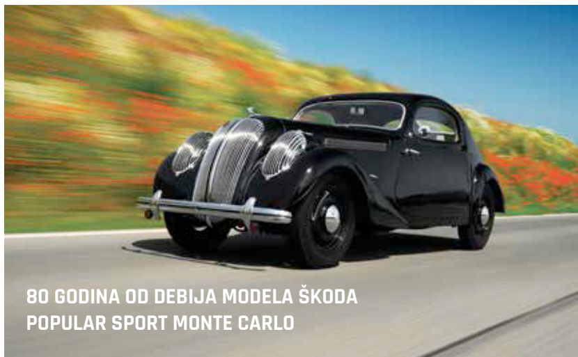
80 GODINA OD DEBIJA MODELA ŠKODA POPULAR SPORT MONTE CARLO

ŠKODA je proizvela 500.000-ito vozilo Rapid, a jubilarni automobil, Spaceback u crvenoj boji, sišao je s trake u matičnoj tvornici u Mlada Boleslavi. ŠKODA Rapid, koji se može kupiti kao limuzinu ili