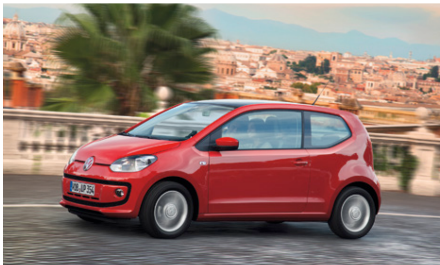
Među TOP 10 automobila u prvih šest mjeseci čak su četiri Volkswagenova modela, Golf, Polo, up! i Passat.